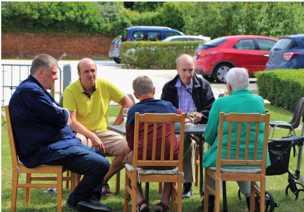
Ontmoeting als centrale 'activiteit' van het Onderweghuis

Hoofdstukken zes en zeven richten zich specifiek op wie zelf graag aan de slag wil gaan. Als jij door het lezen getriggerd wordt om zelf een plek op te starten, vind je hier wat nodig is om er aan te beginnen en nemen we je mee naar enkele lastige kantjes van present zijn. Je vindt ook enkele concrete voorbeelden van presentieplekken. Ten slotte stellen we je ons aanbod aan vorming en ondersteuning voor.